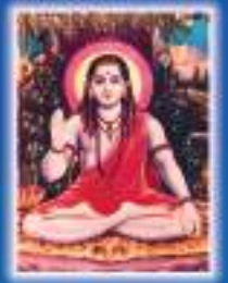
श्री श्री महाशक्ति सुख संस्कारवादी

www.gnv.org.in Mobile App and Facebook page: siddhastham.shakti.kendra