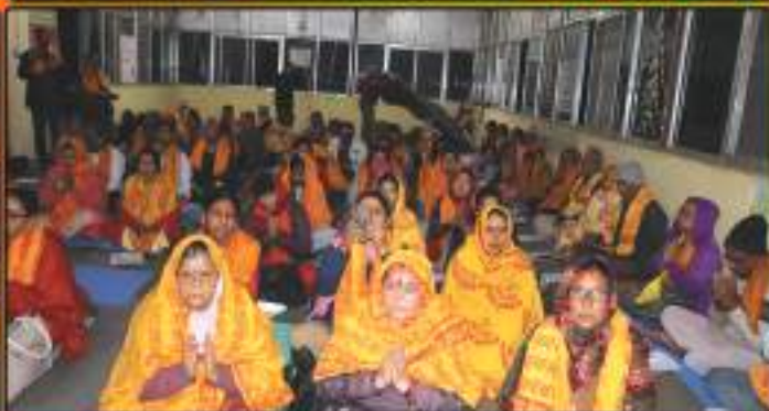
सिद्धाश्रम शक्ति केन्द्रबाट गत कात्तिक १७ गते गोरखाको गोरख गुफामा सम्पन्न अखण्ड हवनका तस्वीरहरू